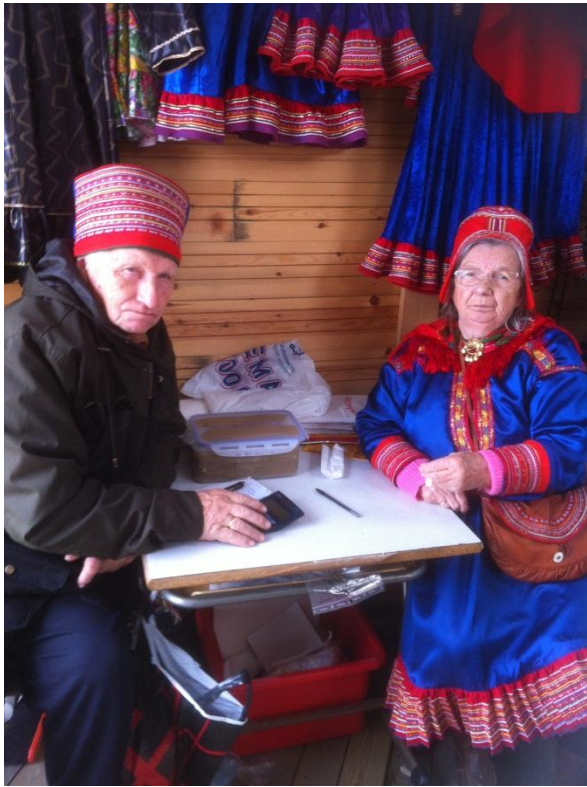
Samer i sina fina kläder. De hade olika saker att sälja